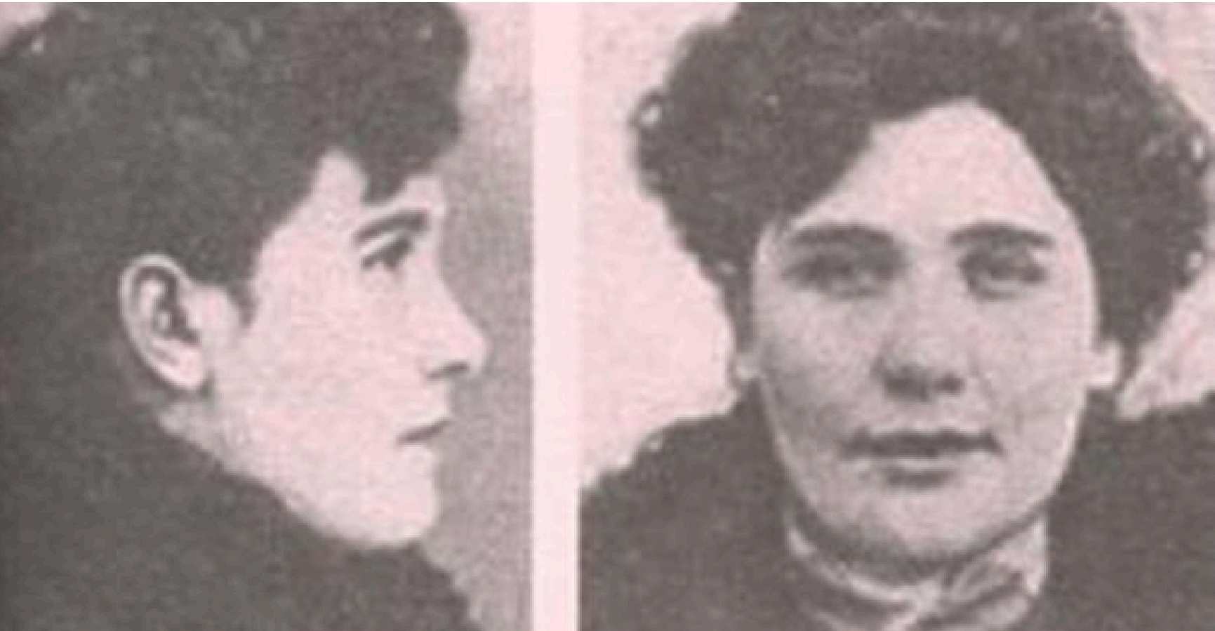
Photographie de Chicago May, saisie lors d'une arrestation et conservée par le tout nouveau système Bertillon.